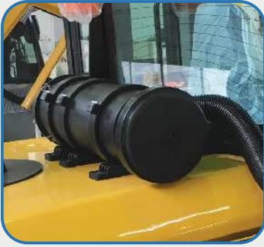
Unser Vorreinigungssystem verlängert die Lebensdauer der Filter